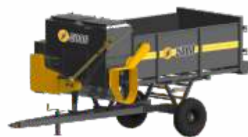
JF 5000 con dosificador (opcional)

DOSIFICADOR Dosificador con sin fine mezcladora y transportadora.