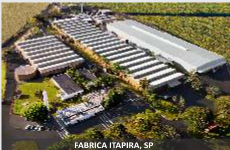
FABRICA ITAPIRA, SP