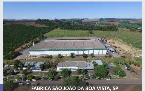
FABRICA SÃO JOÃO DA BOA VISTA, SP

Línea de Preparador y Repartidor de Ensilaje JF, la solución para el ganadero!