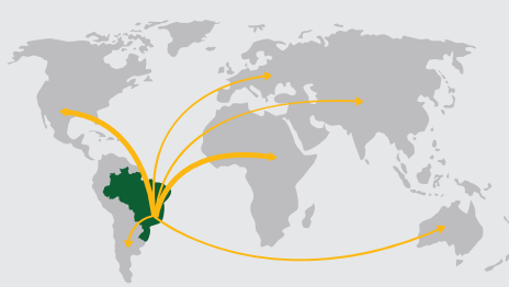
DESDE BRASIL PARA MÁS DE 50 PAÍSES EN TODOS LOS CONTINENTES