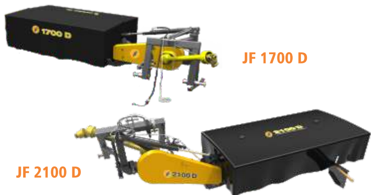
JF 1700 D