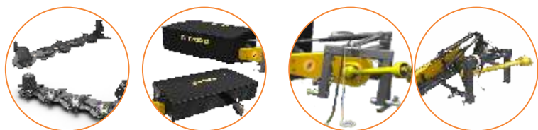
Barra de corte con 4 y 5 discos