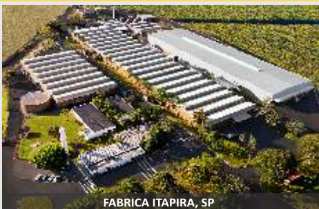
FABRICA ITAPIRA, SP

Heno de calidad, desde el corte hasta el empaque!